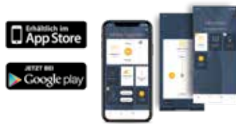
Smart-Home-App TaHoma® App